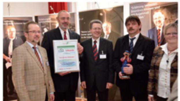
Preisträger Unternehmen mit Weitblick im Kreis Wesel

Die Prämierung der Unternehmen mit Weitblick im Kreis Wesel findet im Rahmen des 50plus-Tages am 18.11.2014 im Kamper Hof in Rheinberg statt.